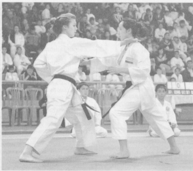
Победы даются в упорной борьбе.