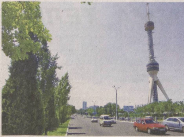
День ото дня хорошеет наша столица.