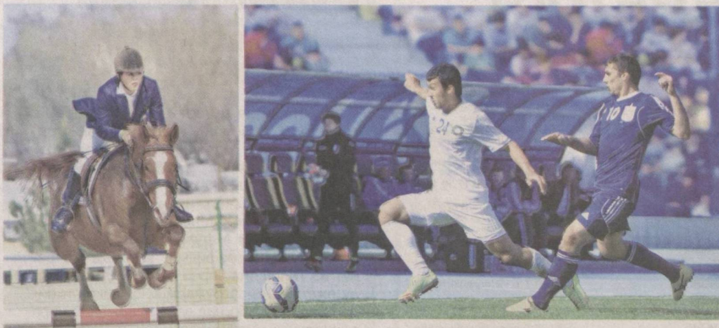
Спорт — трамплин для высоких достижений.