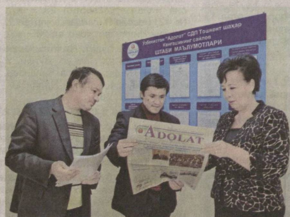
Интенсивными темпами продолжается избирательная кампания по выборам Президента Республики Узбекистан. Кандидаты, выдвинутые от всех партий, и их доверенные лица проводят на местах предвыборную агитацию и пропаганду.

В частности, активно реализуется работа по широкой пропаганде целей и задач, выдвинутых в программе кандидата в Президенты Республики Узбекистан от Социал-демократической партии Узбекистана, а также по организованному проведению предвыборной агитации с участием партийных организаций всех уровней.