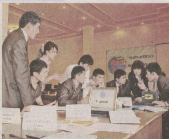
В настоящее время в рамках предвыборной агитации проводятся встречи кандидатов в Президенты Республики Узбекистан, выдвинутых всеми политическими партиями, и их доверенных лиц с избирателями.

В этом процессе Движением предпринимателей и деловых людей – Либерально-демократической партией Узбекистана проводится широкая пропаганда идей и задач, выдвинутых в предвыборной программе кандидата в Президенты Республики Узбекистан, а также работа по организации на высоком уровне предвыборной агитации с участием организаций партии всех уровней.