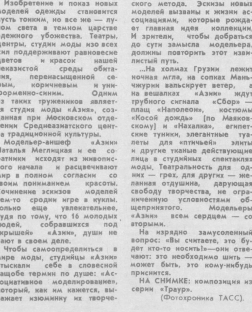
На холмах Грузии лежит ночная мгла, на сопках Маньчжури вальсирует ветер, а на вешалках «Азии» ждут трубного сигнала «Сбор» — плащ «Наполеон», костюмы «Косой дождь» (по Мазковскому) и «Махалла», египетские туники, элгантные туалеты для «птичьей» зилты и другие тшкые действующие лица в студийных спектаклях моды. Театральность для одних — грех, для других — желанная отдушина, дарующая свободу творчества, не ограниченную условиями бытия.

Чтобы самоопределились в мире моды, студия «Азия» отсылала себе в словесной нацбате термин по душе: «Ассоциативное моделирование», который, как им кажется, выражает изюминку их творче-