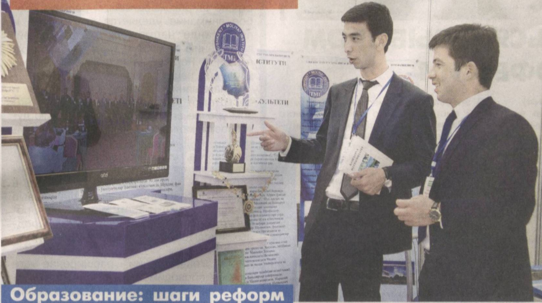
Образование: шаги реформ