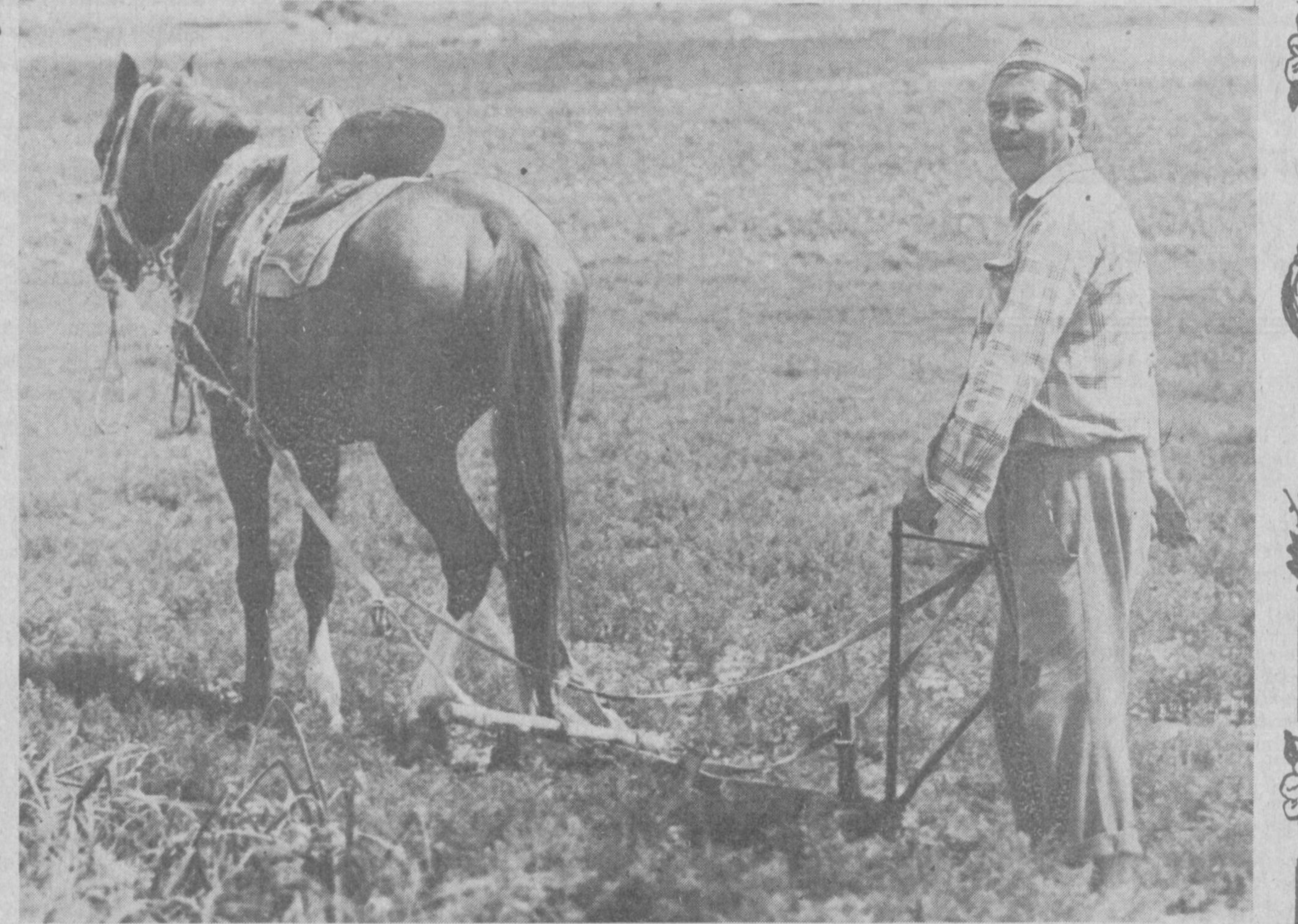
Она заминга меҳр.