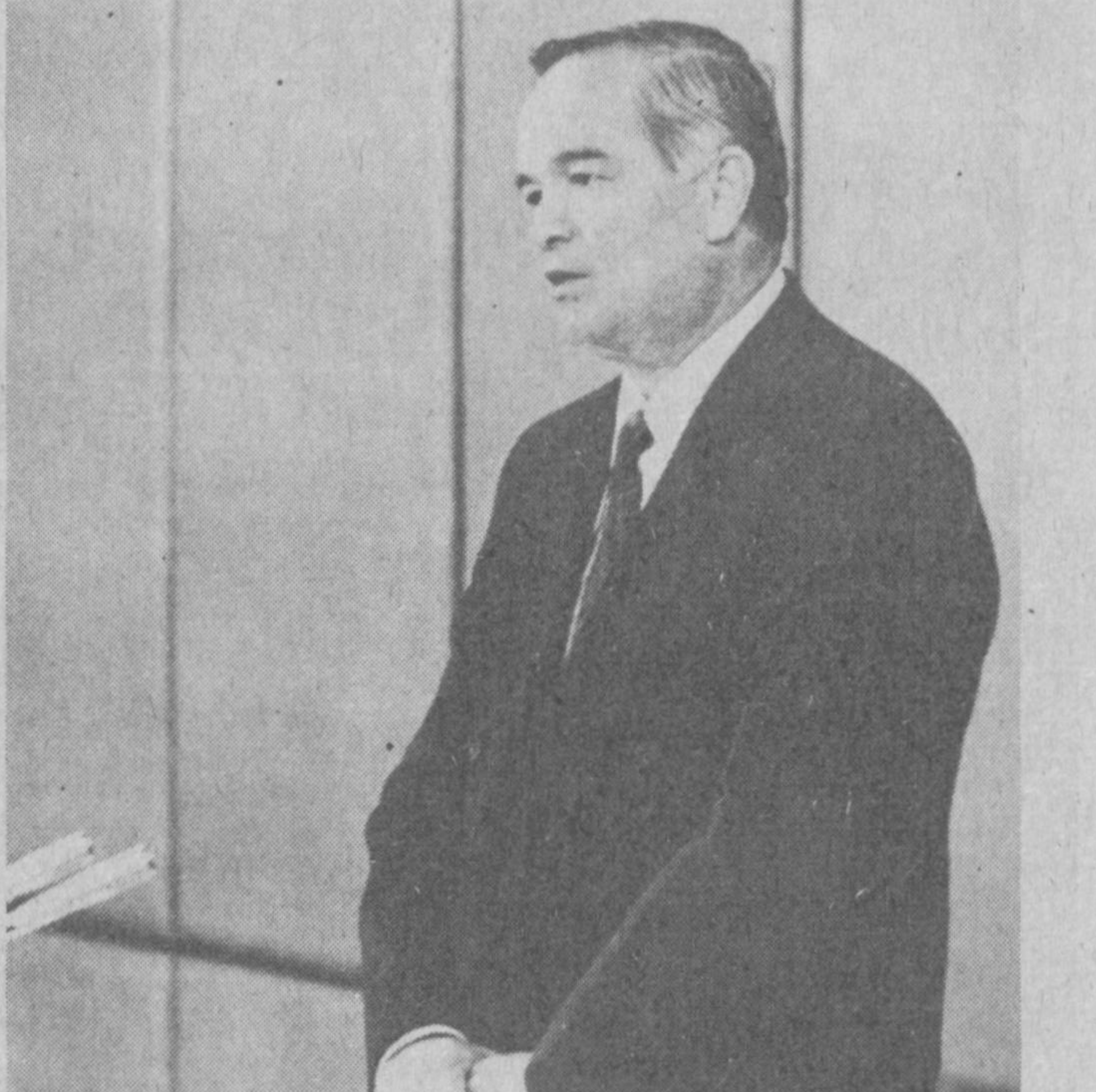
Ислом ҚАРИМОВ, Президент