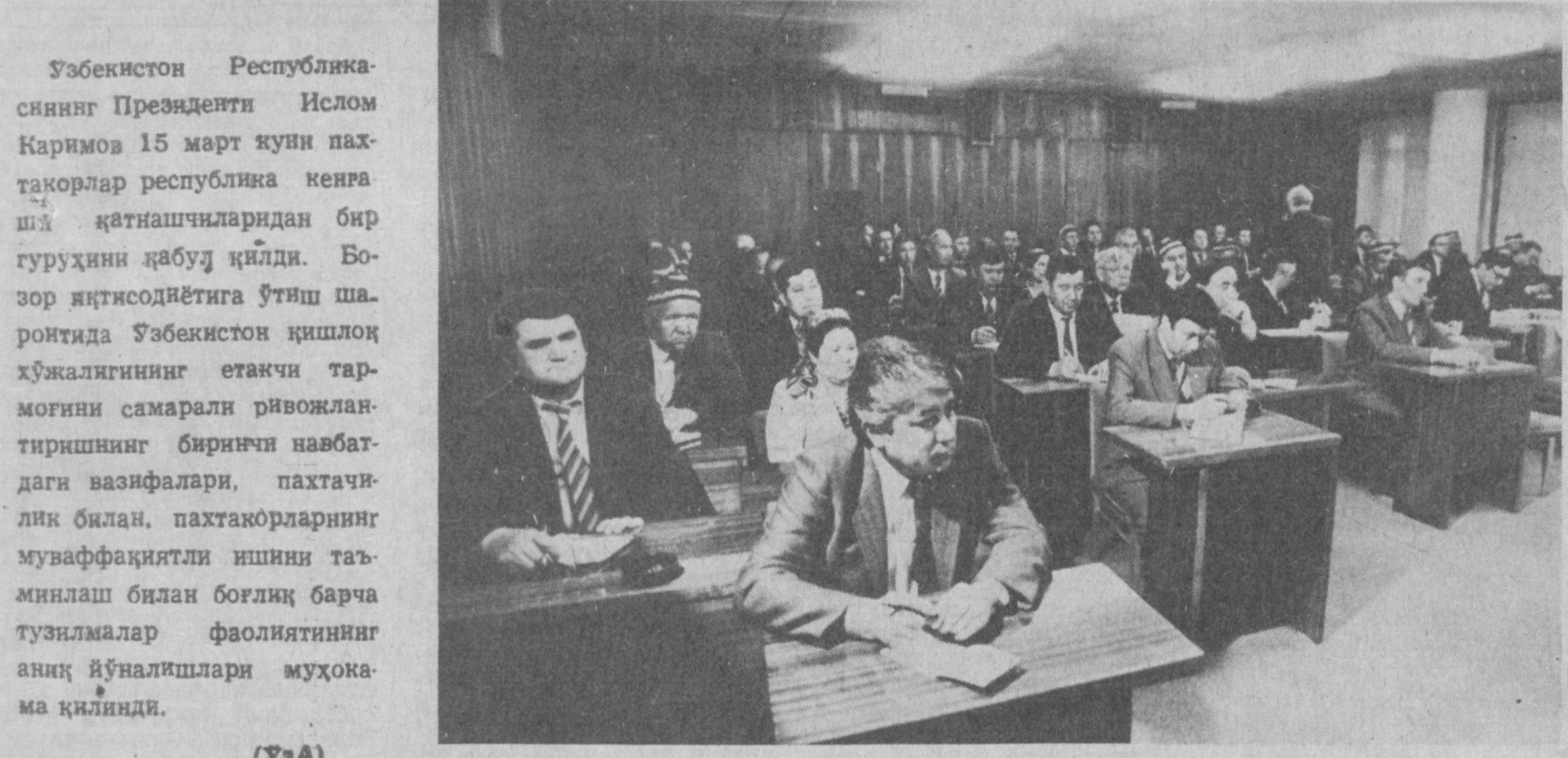
Учрашув чоғида.