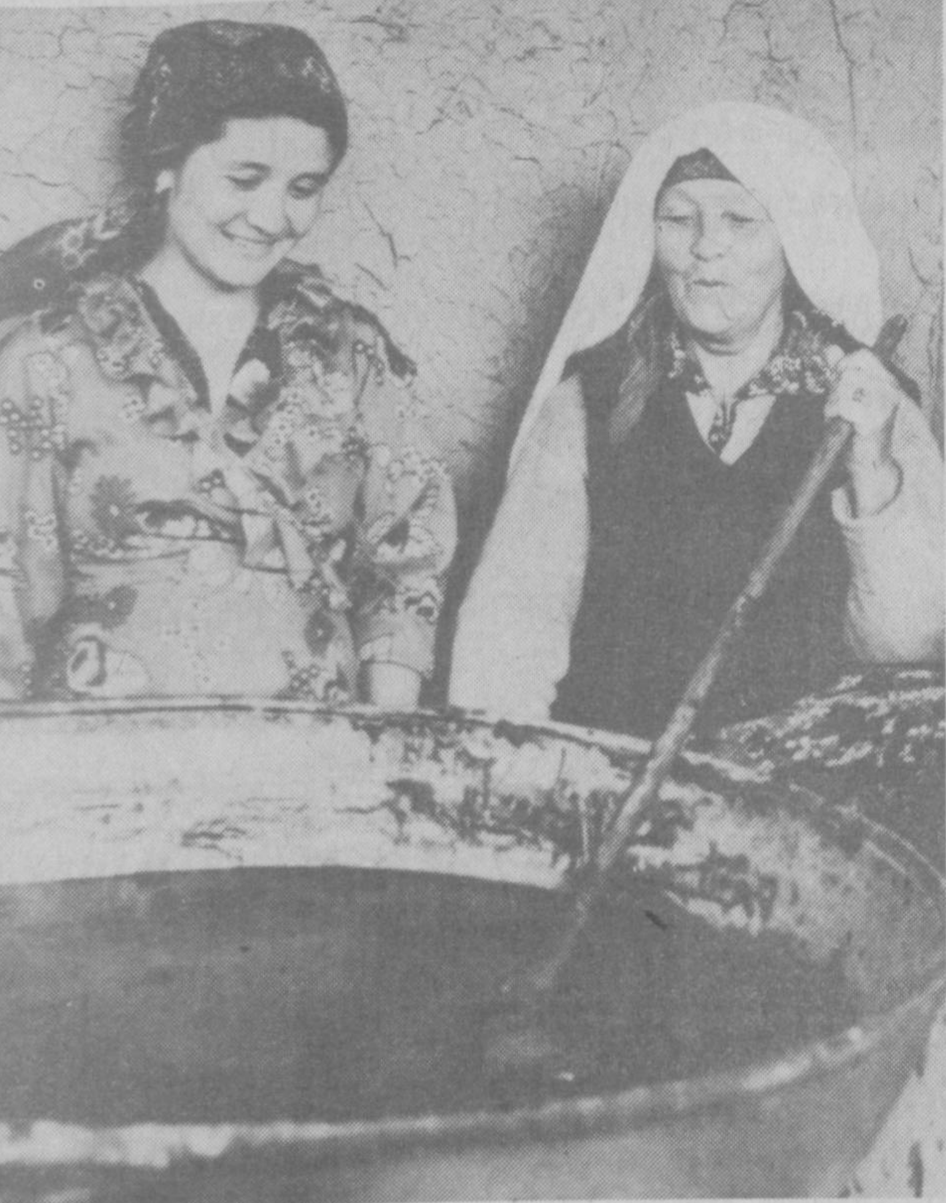
Сумалак ҳам пишай деб қолди.

Наврўз тикланиб яхши ишлар қилинапти. Лекин ҳали тўла ўз йўлига тушиб ололмаган йўқ. Мажлислар, ваъзалар, табриқлар тенден-цияси устунилик қилиб кел-ляпти. Бу наврўз эътиботи бўлмасайди. Ҳозирги вазиат, Сулаймон АЗИМОВ.