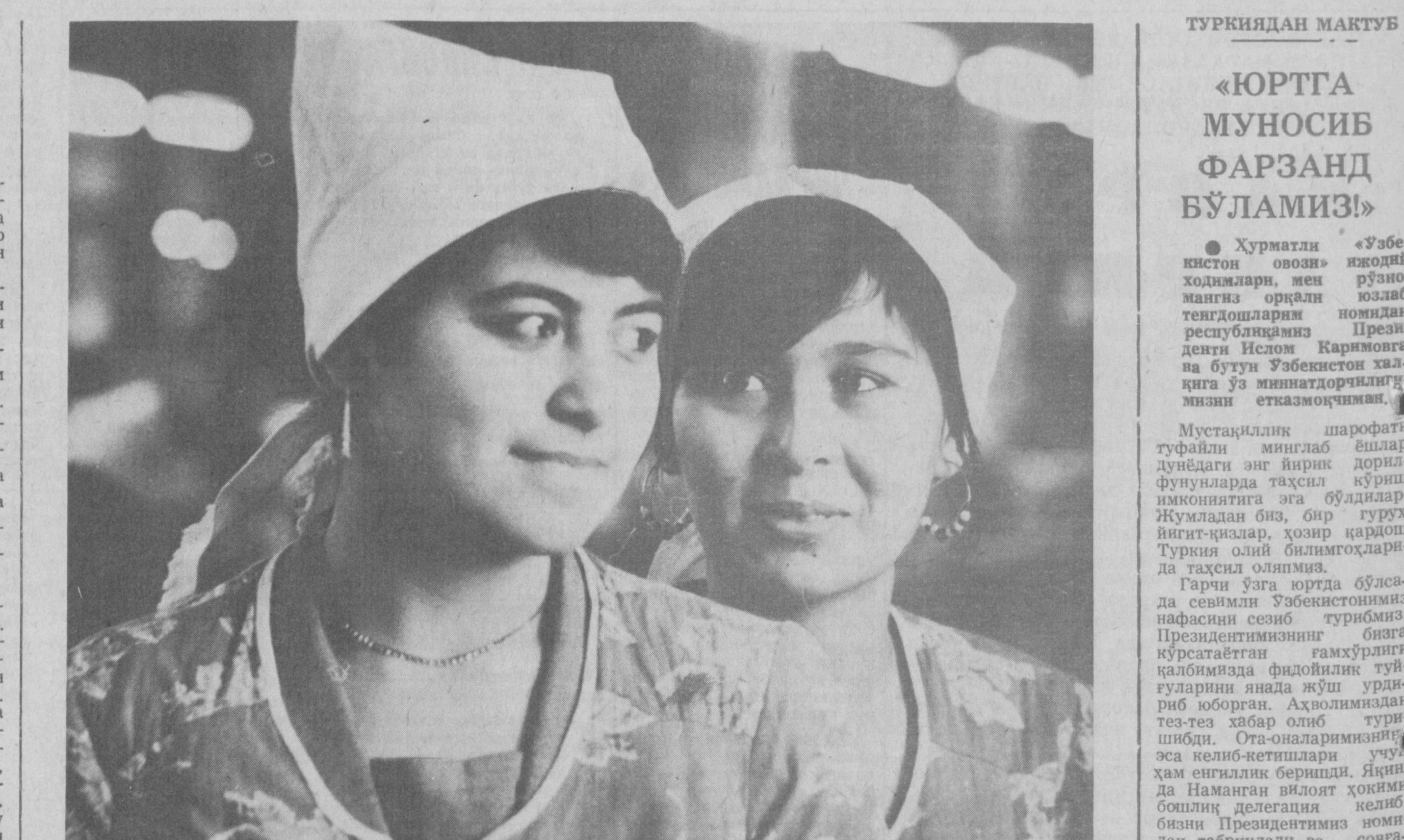
Тошкентдаги чарм-галантерия ва спорт буюмлари ишлаб чиқариш бirlашмаси меҳнатчилари ҳозирги пайтда халқимизга қўлаб маҳсулот етказиб беришга ҳаракат қилишяпти.