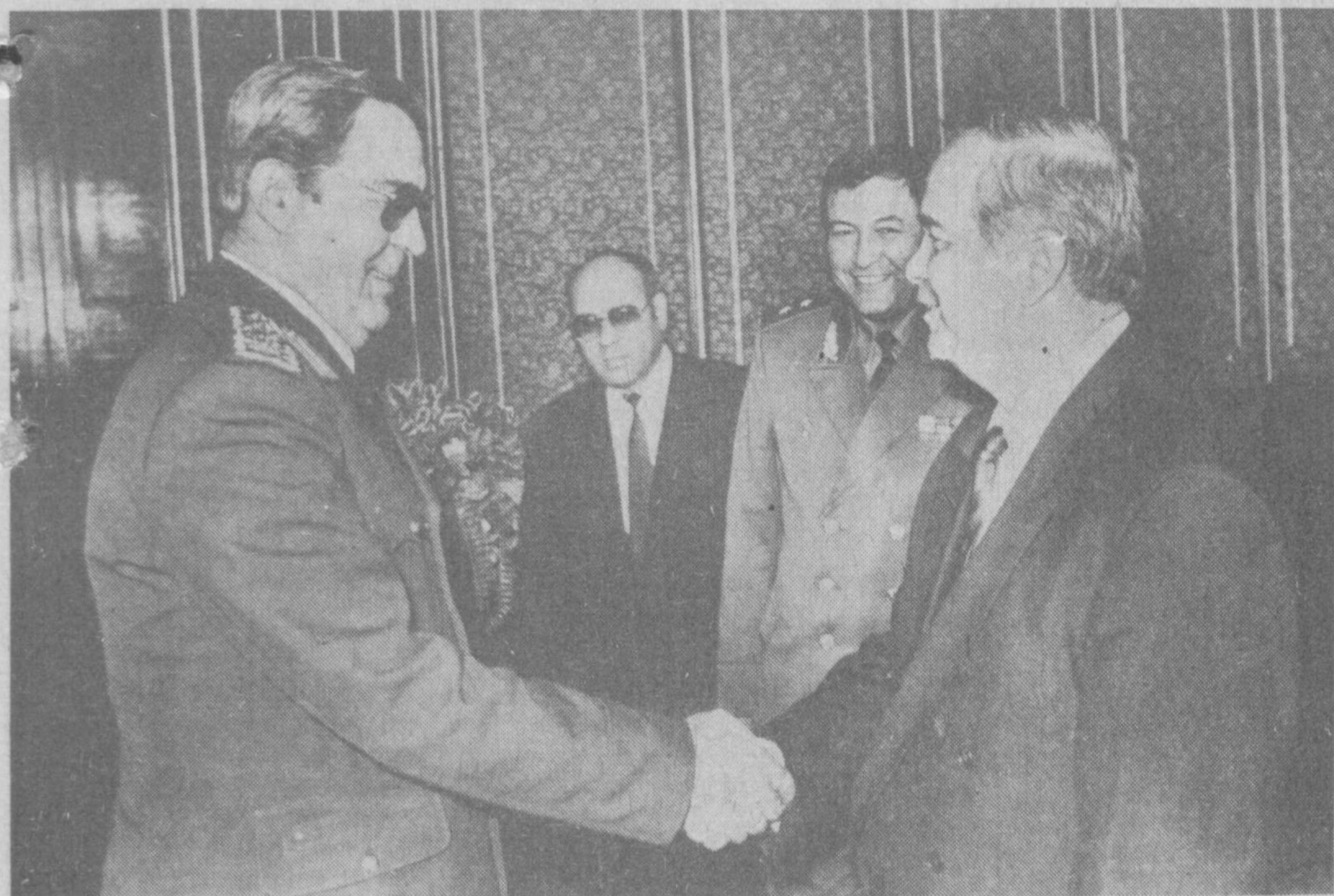
СУРАТДА: қабул пайти.

16 март кuni Ўзбекистон Республикаси Президенти Ислам Каримов Туркия Республикаси Қуролли Кучлари бош штаби бошлиғи, армия генерали Дўғон Гурешни қабул қилди.