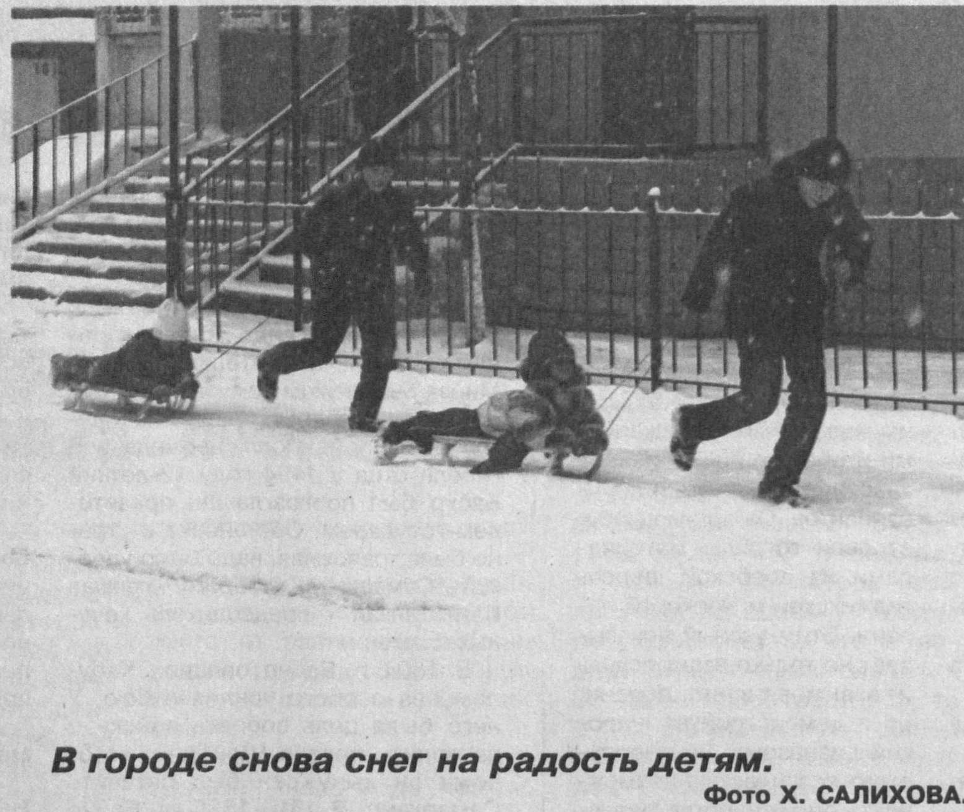
В городе снова снег на радость детям.