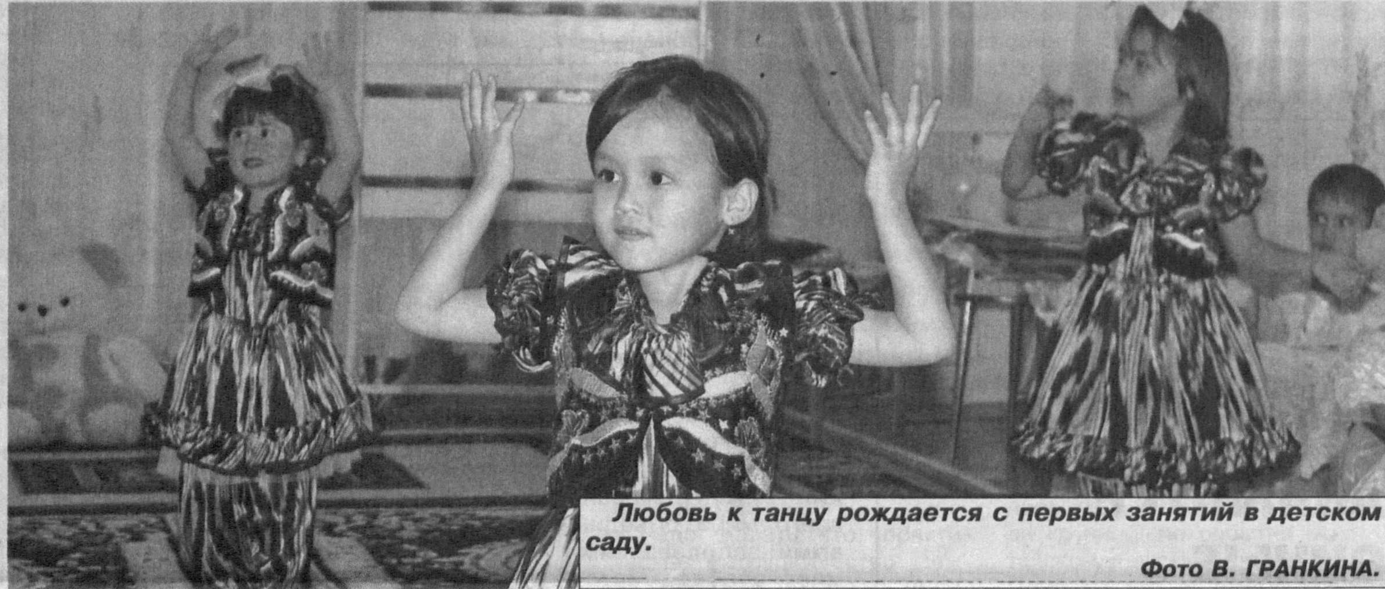
Любовь к танцу рождается с первых занятий в детском саду.