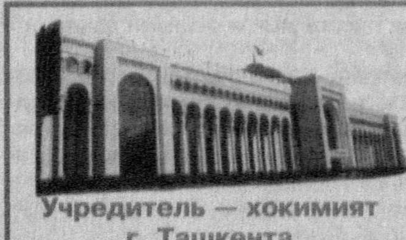
Учредитель — хокимият г. Ташкента

Адрес редакции: 100029, г. Ташкент, ГСП, ул. Матбуотчилар, 32.