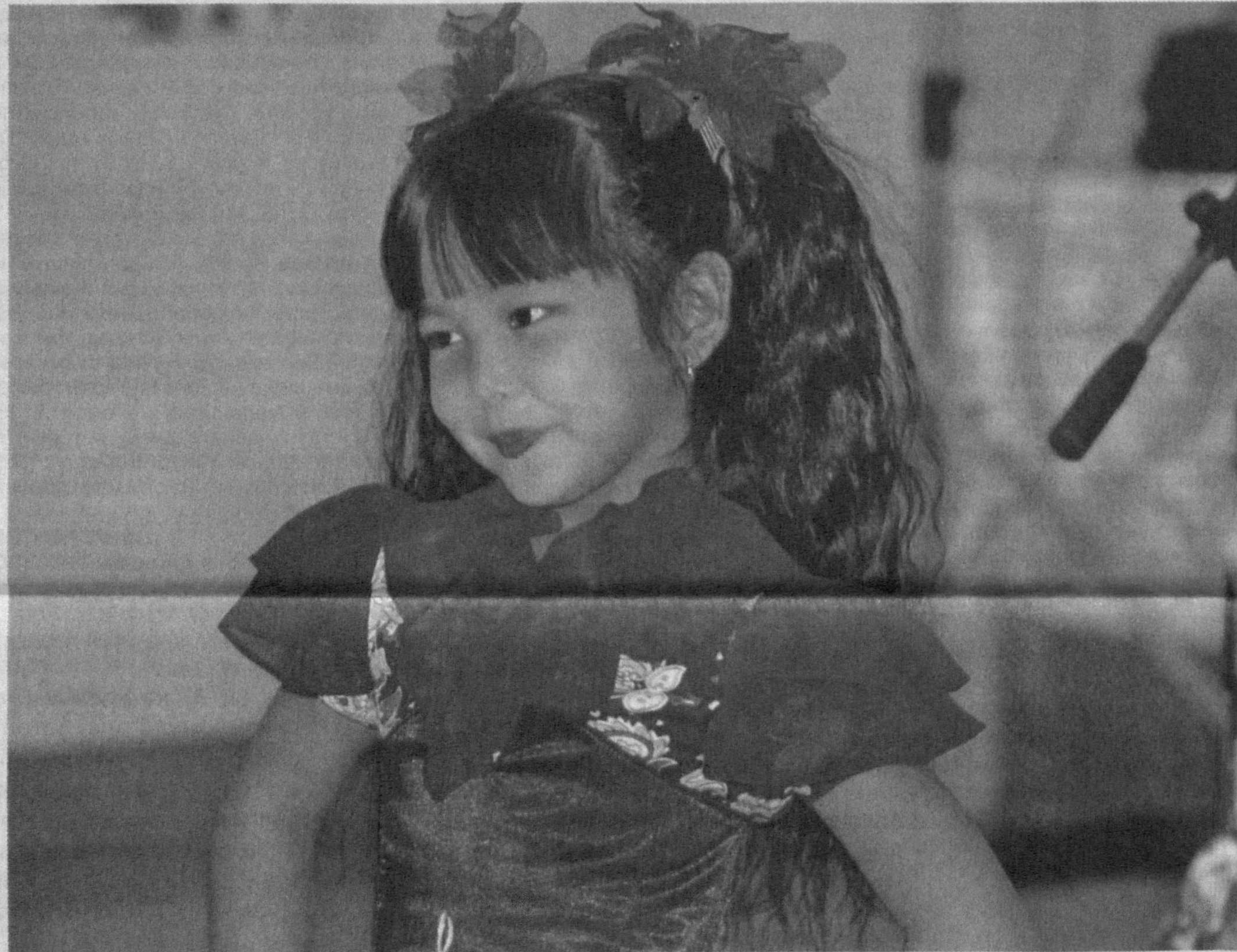
Настроена показать хороший танец.

Само название хина нингё появилось в эпоху Эдо, датируемую 1603-1867 гг., а национальный Праздник кукол стал со второй четверти XVIII века. Считается, что своей популярностью он во многом обязан 8-му Сёгуну из династии Токугава – Ёсимунэ (1677-1751), который имел много дочерей. Тогда же добавились обычай устраивать в этот день в домах, где есть девочки, выставки богато одетых кукол, изображавших жизнь императорского двора. Современный праздничный набор хина нингё в виде императорского двора, был составлен в конце эпохи Эдо и включал в себя кукол из Киото и Эдо. Первоначально праздник отмечался только при дворе и среди воинского сословия, но вскоре стал очень популярен и среди простых людей.