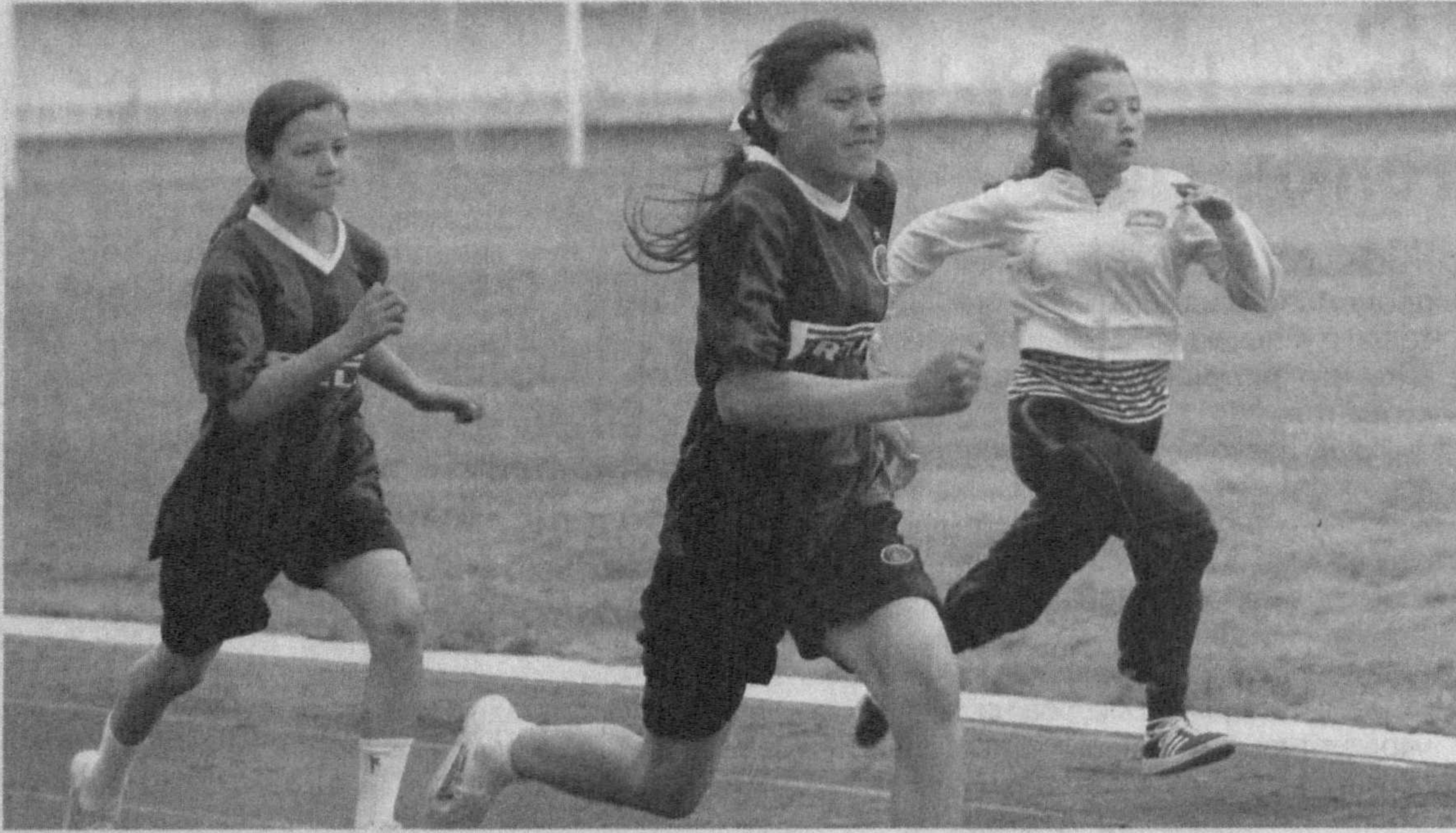
На развитие массового спорта, особенно детского, направлены многочисленные соревнования, проводящиеся в столице.