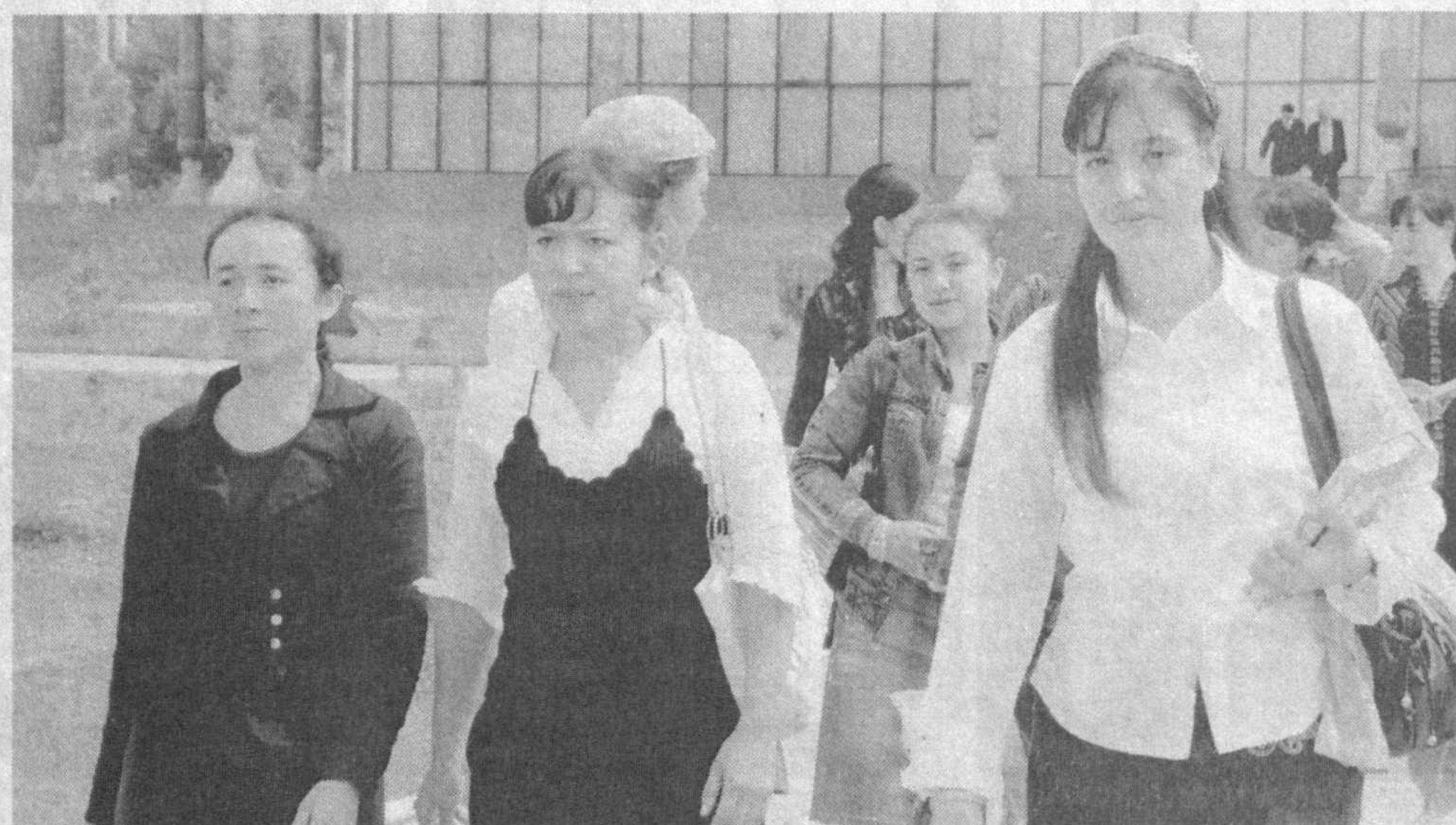
Путь к выбору профессии выпускникам открывают дни открытых дверей в колледжах и лицеях.