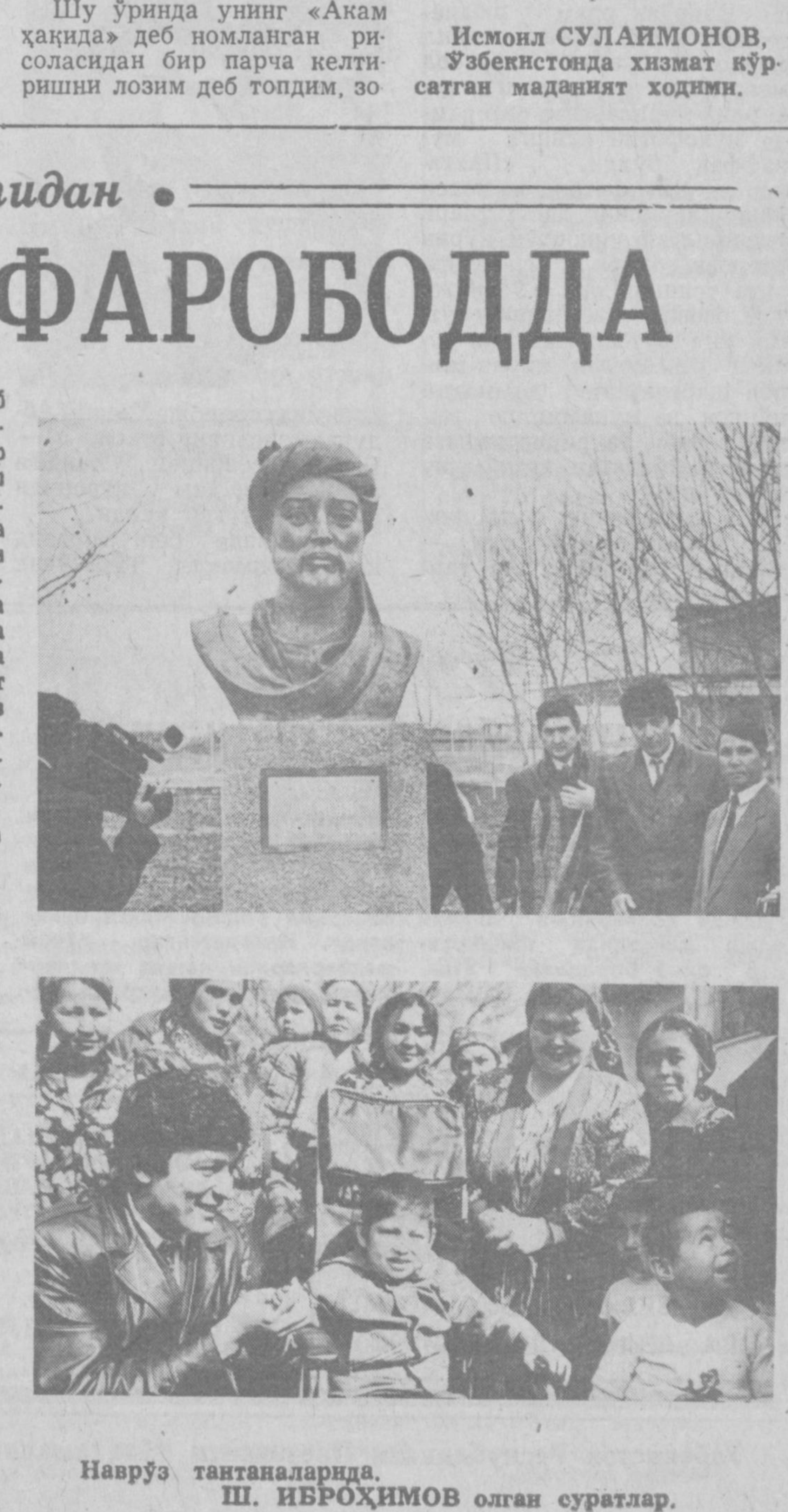
Наврўз таъналарига.