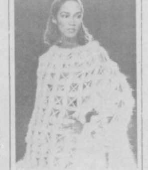
Кан долина выглядит современная женщина! Свой вариант предложили испанские модельеры, показавшие новые модели в Мадриде.

Однако красоваться с такими зубами долго не приходится — они быстро разрушаются. Тогда снова надо обращаться к умельцу, который опять же зубилом сбивает остатки зубов до основания, просверливает в корнях дырки и вставляет в них новые, искусственные. Они сидят довольно крепко, но при желании их можно выцарапать, предвзвешенно расщавляя, и заменить другими.