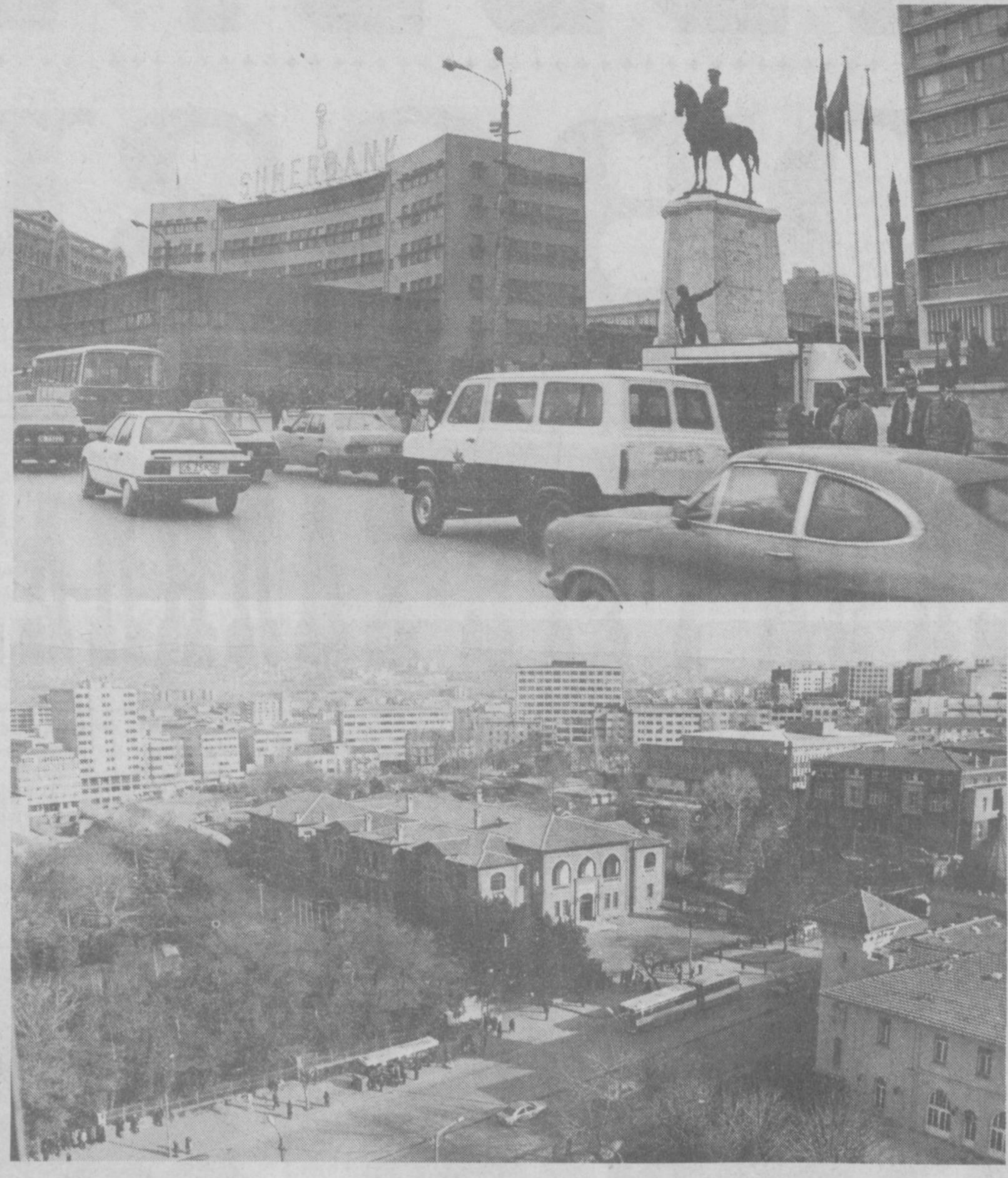
Бугунги Туркия шаҳарлари ана шундай мафтункор манзарага эга.

1991 йилнинг декабрида олис Анкарадан Туркия Республикаси ҳукумати Ўзбекистоннинг миллий муштараклигини биринчи бўлиб тан олгани тўғрисида хушхабар келган эди. Шундан бери ўтган қисқа вақт мобайнида республикамиз Президентини Ислон Каримов Туркияга бир неча бор сафар қилди. Туркия Бош вазирлиги Сулаймон Демиррел бошлиқ ҳукумат делегацияси республикамизга келиб кетди. Мамлакатларимиз ўртасидаги ўзаро манфаатли алоқалар ўффи кундан-кунга кенгайиб бормоқда. Бу расмий сафарлар чоғида имзоланган бир қанча битим, шартнома ва протоколлар икки давлат ўртасидаги муносабатлар ривожланишига ҳуқуқий асос бўлиб хизмат қилмоқда. Ўзбекистон ва Туркия ўртасида имзоланган бундай муҳим ҳужжатлар сирасига савдо ва иқтисодий ҳамкорлик, сармоя сарфлашини ўзаро рағбатлантириш ва ҳимоя қилиш, транспорт ва алоқа соҳасида ҳамкорлик, қуруқлик транспорти, маданият, фан, таълим, соғлиқни сақлаш, спорт ва туризм соҳасида ҳамкорлик қилиш тўғрисидаги битимлар ҳамда бошқа протокол ва меморандумлар кирди.