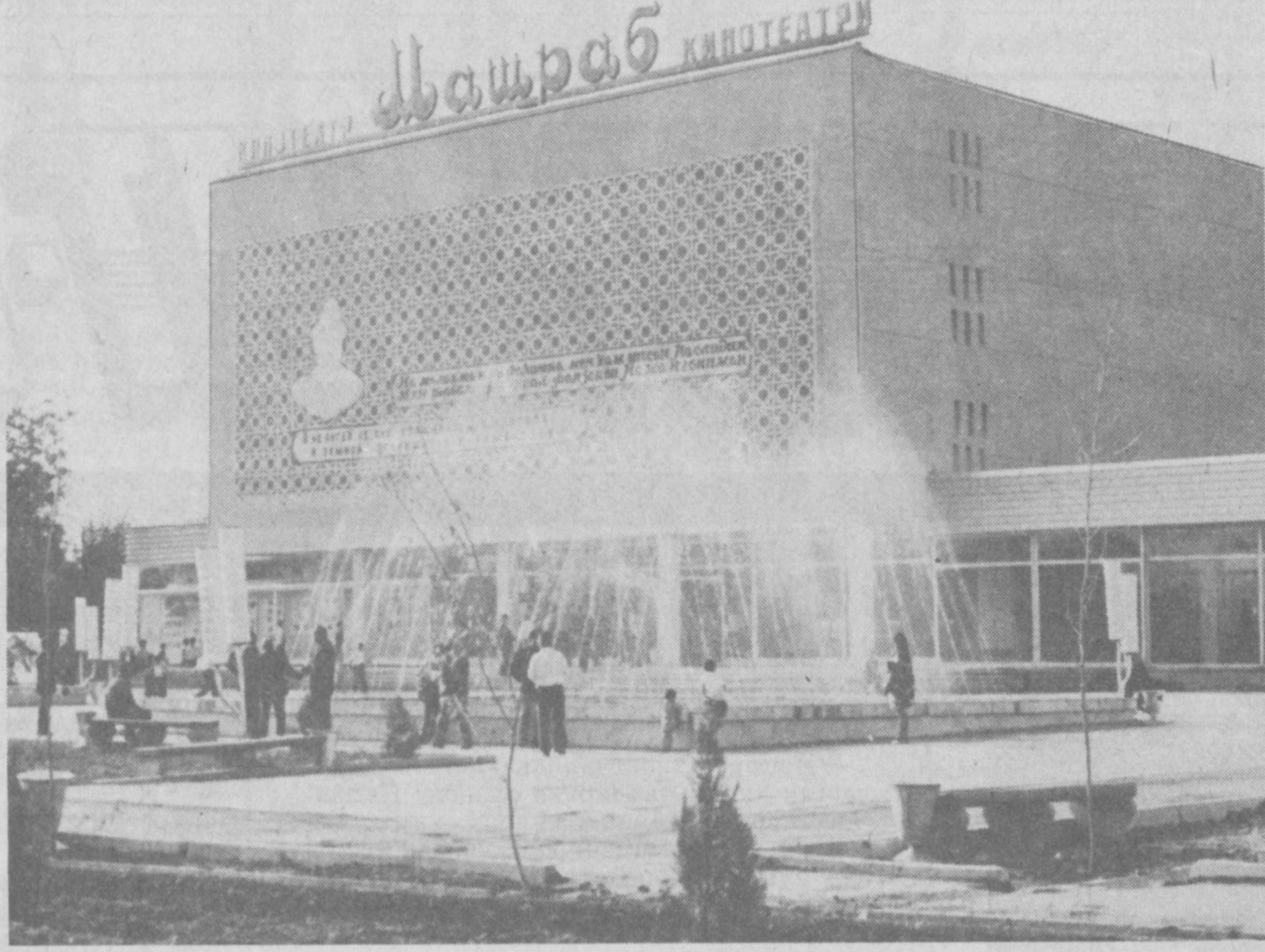
Наманган шаҳридаги «Машраб» номли кинотеатр. (ЎЗА).

Тўшкент Давлат дорилфунуниндан йўқолган ЦВ 763476 рақамли диплом БЕКОР ҚИЛНАДИ