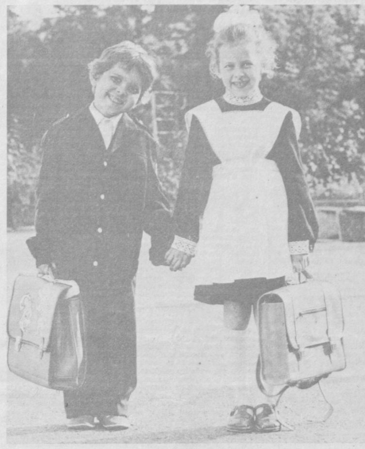
Распахнули двери школы

Сегодня—День знаний ЗДРАВСТВУЙ, НОВЫЙ УЧЕБНЫЙ!