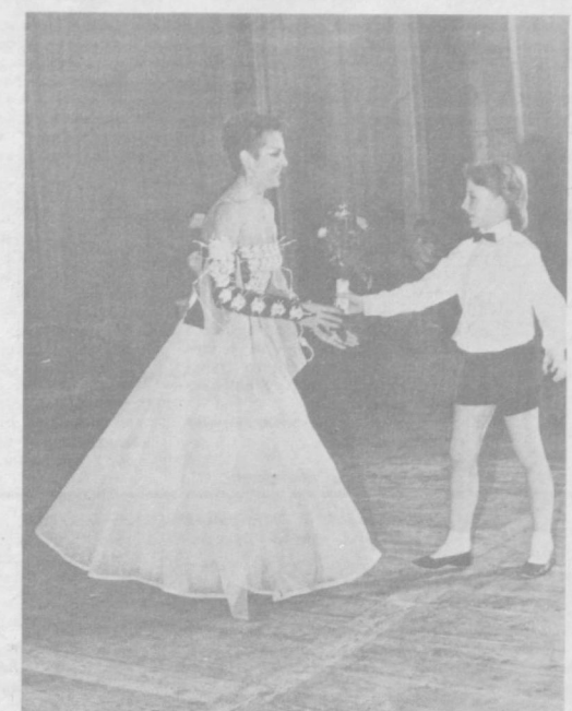
Цветы прекрасной даме.