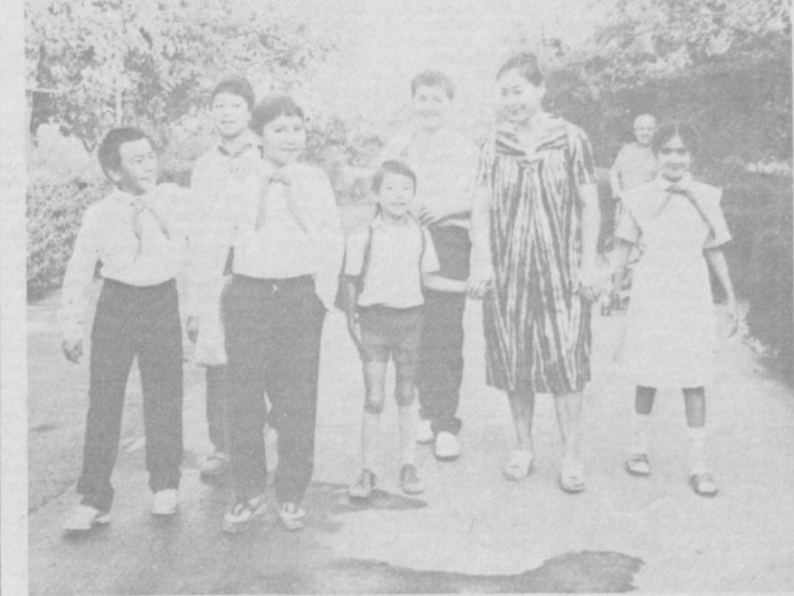
Этот снимок сделал наш внештатный фотокорреспондент Х. Саликов в первый день нового учебного года.