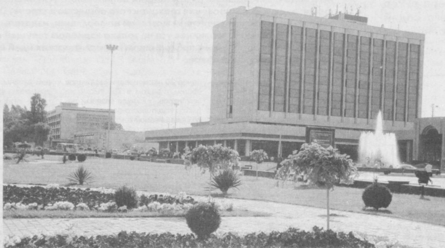
Мой любимый город.