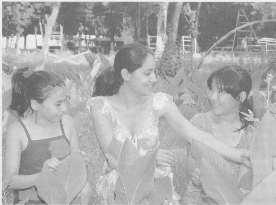
Приятно в летний день отдохнуть на природе.