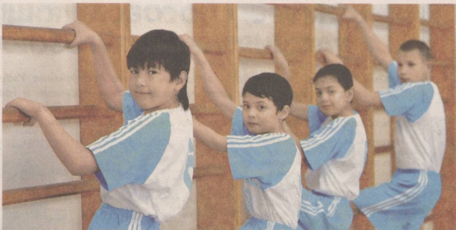
Дорога к профессиональному спорту прокладывается с детства.