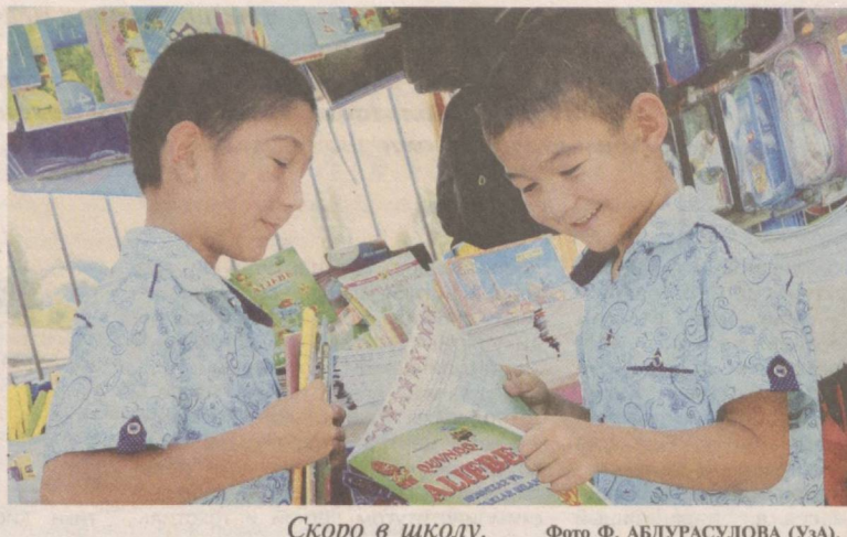
Скоро в школу.