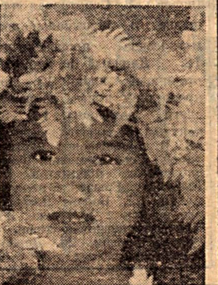
тами, композициями из живых или засушенных цветов.

Если вы страдаете поллинозом, в опасную для вас пору следует отказаться от моркови, персиков, груш, манго, киви, ананасов, меда, горчицы. Не пейте также шампанское и виноградные вина. Дома можно установить мощные кондиционеры для очистки и увлажнения воздуха или хотя бы увлажнитель занавески на окнах утром и вечером. По улицам лучше гулять в вечернее время или после дождя. Не стоит использовать в это время шампунь, крем, лосьоны, дезодоранты, на которых нет пометки «гипоаллергенные». Не разводите дома герань, бегонию, плющ обыкновенный, они могут спровоцировать развитие аллергической реакции. Не украшайте свой дом букетами, композициями из живых или засушенных цветов.