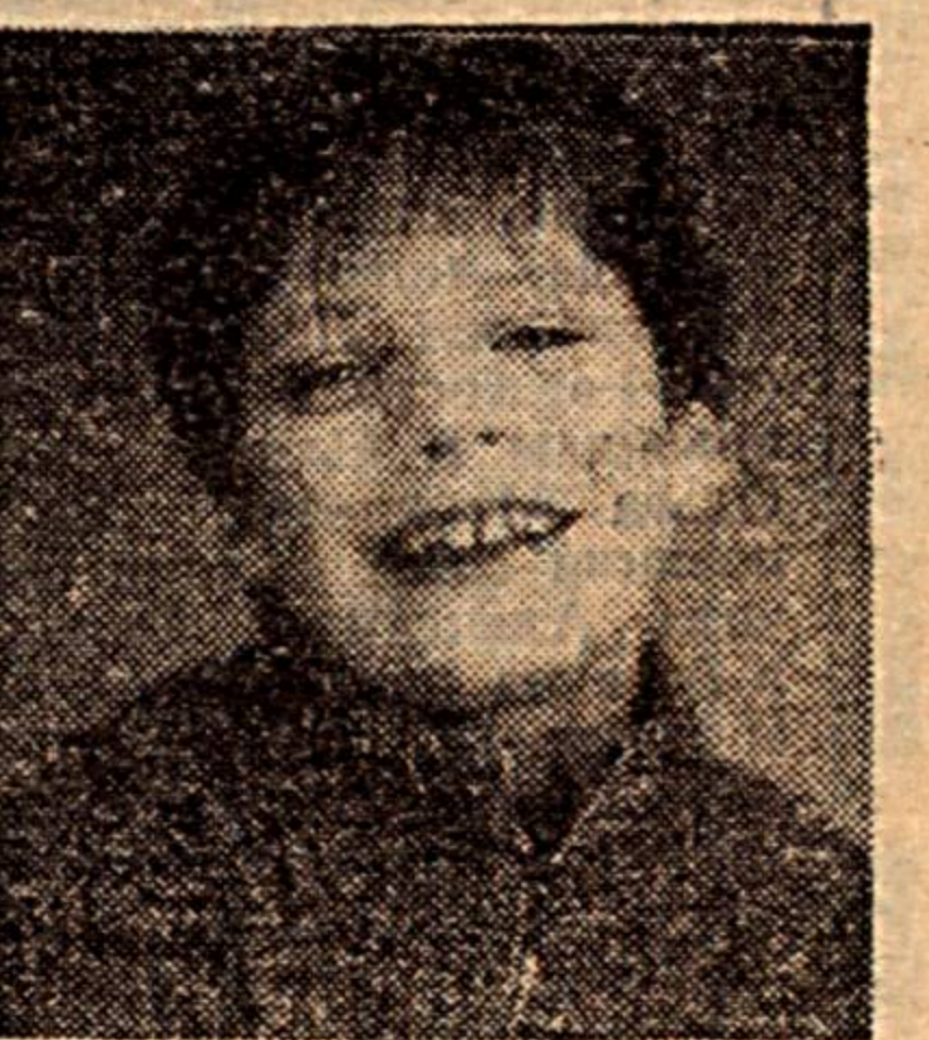
— Не бойся, бабушка, у меня зубы не выпадут. Подготовил Б. САИДОВ.

— Внучек, когда ты кашляешь, прикрывай рот ладошкой.