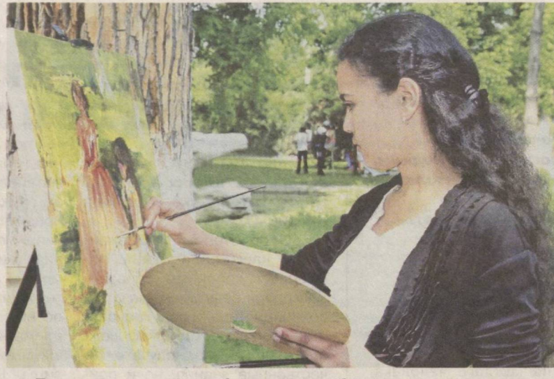
Творческая мастерская под открытым небом.