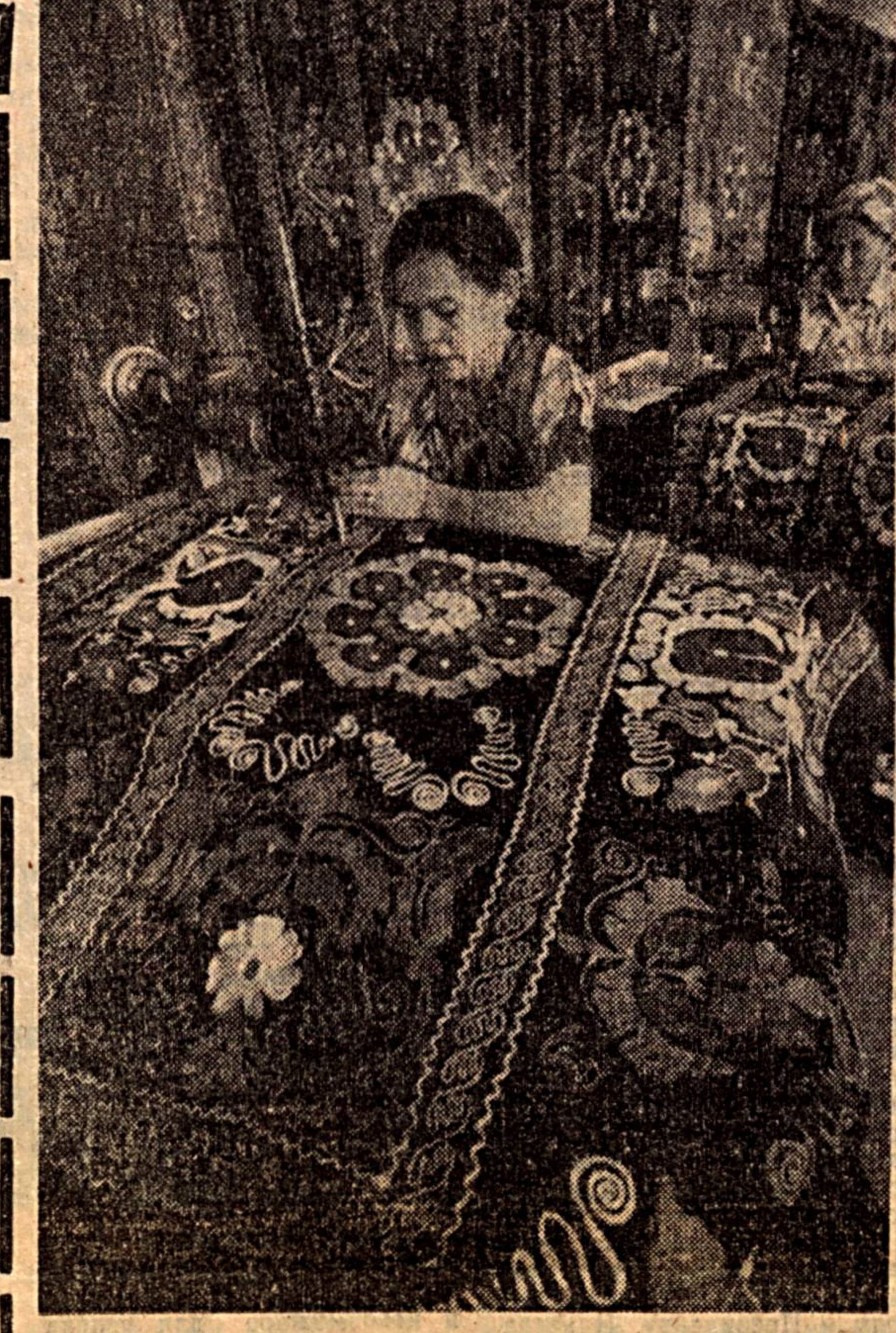
Сузанининг ҳар бир нақши муҳаббатдан, вафодан баҳс этади...