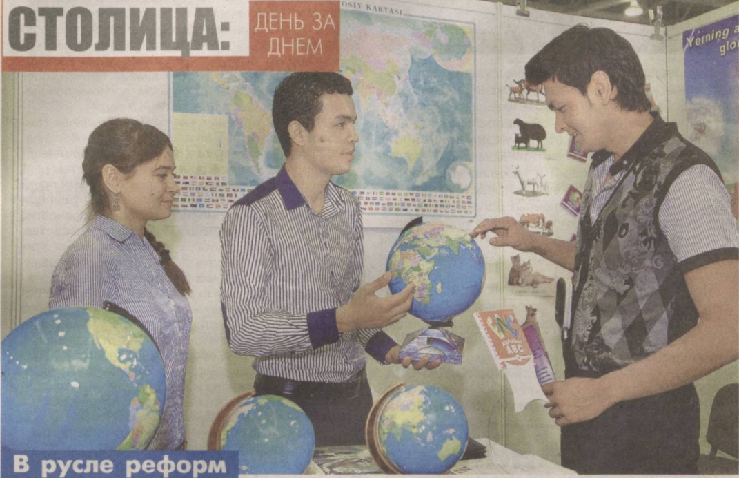
В русле реформ