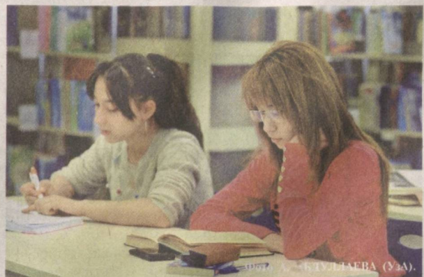
Лучший отдых — чтение!