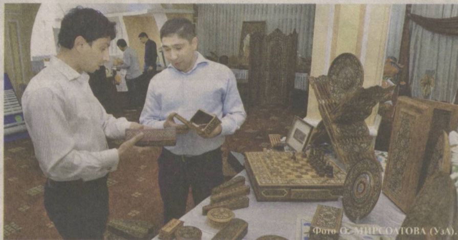
Многообразен и красив мир отечественного народного искусства.

100129, город Ташкент, улица Навои, дом 30. Творческий союз журналистов Узбекистана, 3-й этаж, кабинеты 30, 35. Телефоны: 244-64-61, 244-37-87. Web: www.journalist.uz