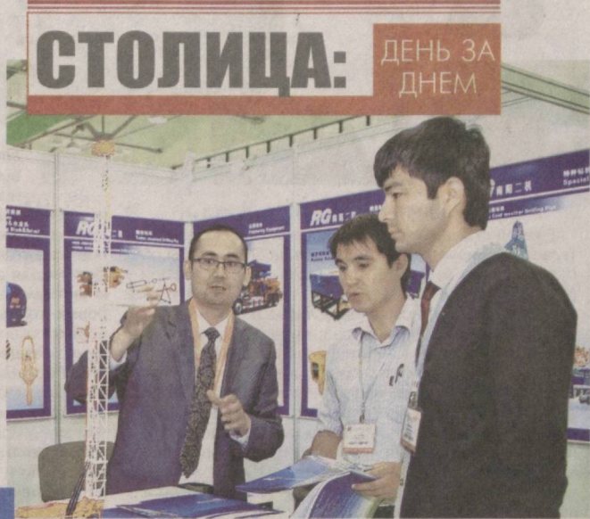
СТОЛИЦА: ДЕНЬ ЗА ДНЕМ

– Объявление 2015 года в Узбекистане Годом внимания и заботы о старшем поколении является важной инициативой руководства республики. Проявление уважения, почитания и заботы о представителях старшего поколения является показателем духовности и высокой культуры узбекского общества. (Окончание на 3-й стр.)