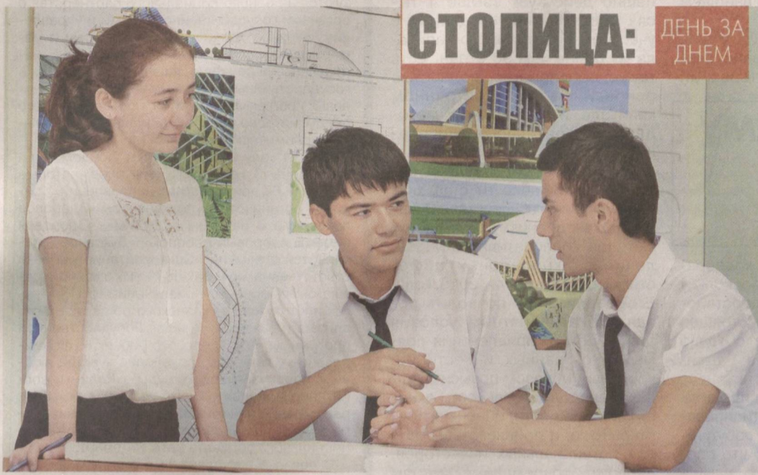
Молодежь готовит новые проекты.