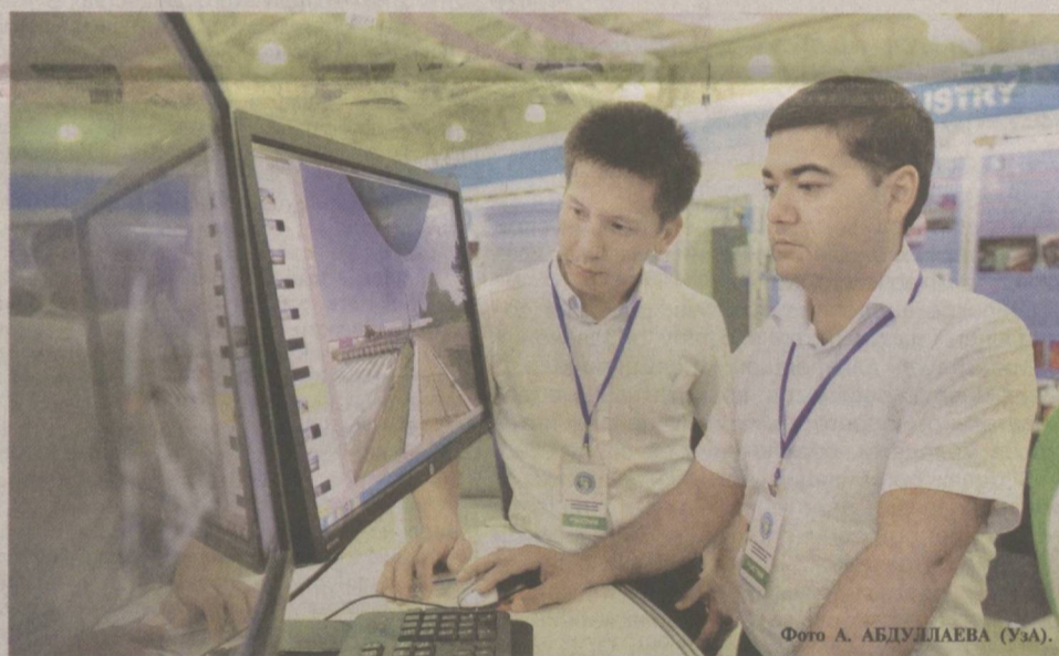
Компьютерная грамотность – требование времени.