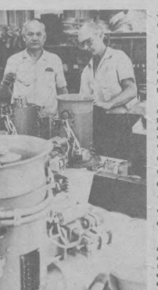
Предприятие «Среднегазавтоматная» — одно из передовых в районе.

● Искются 3 больницы на 2.290 коек, 7 поликлиник, в том числе 2 детские и 1 стоматологическая. На ближайшее время запланировано строительство детских садов на массиве «Иззат» — квартале 31, в микрорайоне «Уркизар», школ на