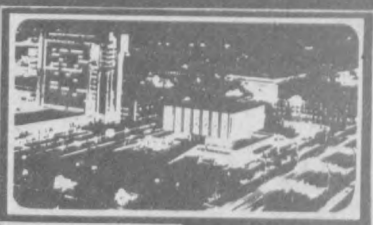
Газета выходит с 1 июля 1966 года