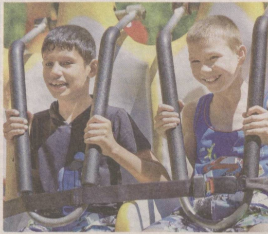
Лето — пора каникул.