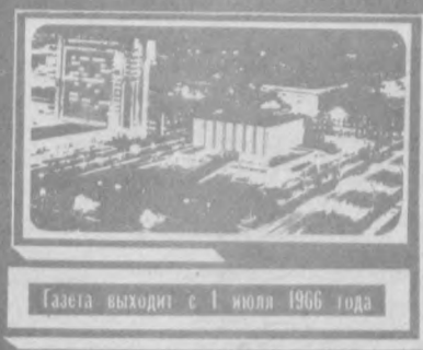
Газета выходит с 1 июля 1966 года