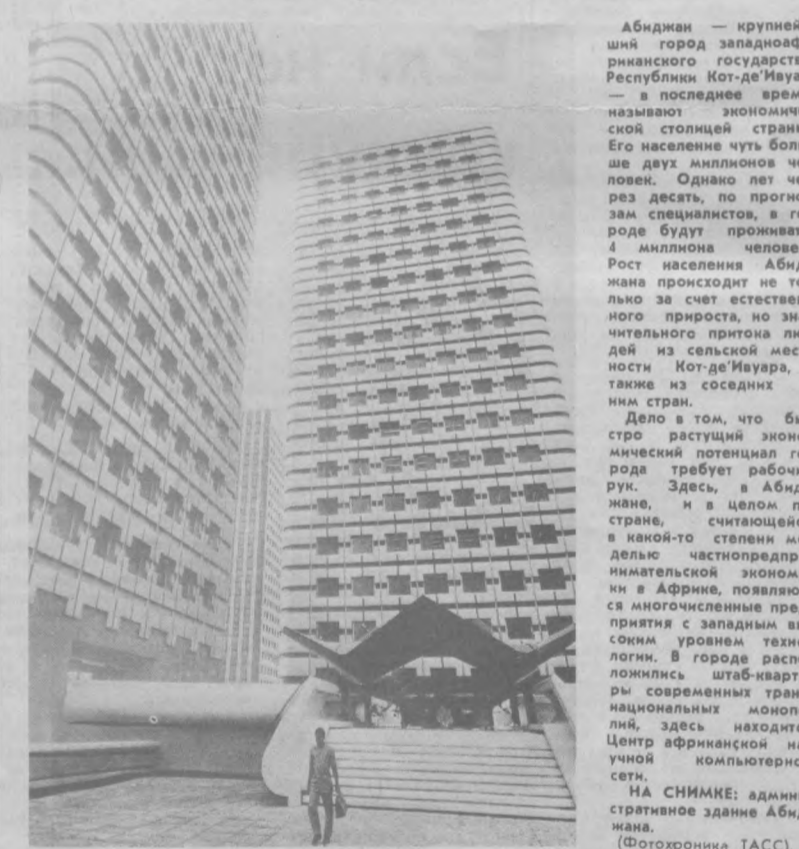
Абиджан — крупнейший город западноафриканского государства Республика Кот-д'Ивуар — в последнее время называют экономиче...