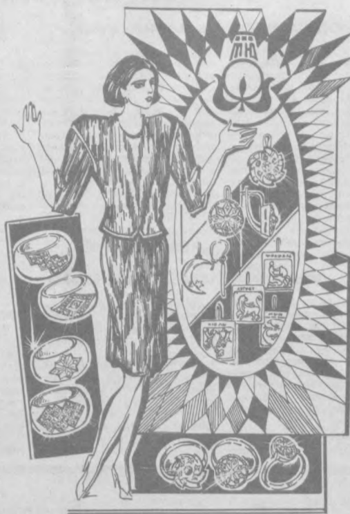
Узбекское рекламное производственное предприятие ВПО «Союзреклама».