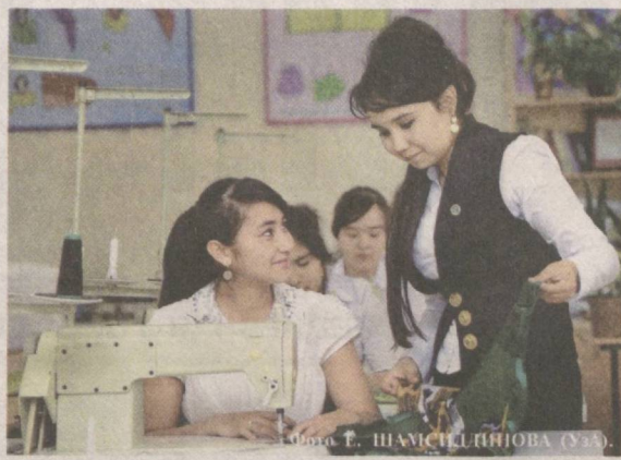
Осваивая собственное дело.

В Ташкенте состоялось заседание, посвященное совершенствованию системы государственных закупок. В нем приняли участие представители Министерства финансов Республики Узбекистан, Генеральной прокуратуры, Торгово-промышленной палаты, Счетной палаты, Республиканской товарно-сырьевой биржи, Центра поддержки товаров субъектов малого бизнеса.