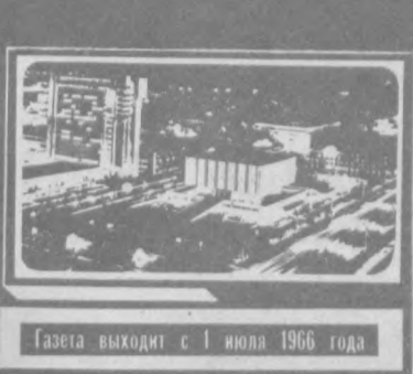
Газета выходит с 1 июля 1966 года