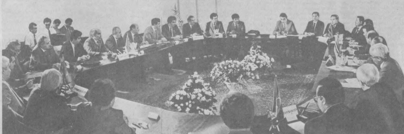
Во время переговоров.