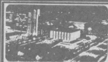
Газета выходит с 1 июля 1966 года