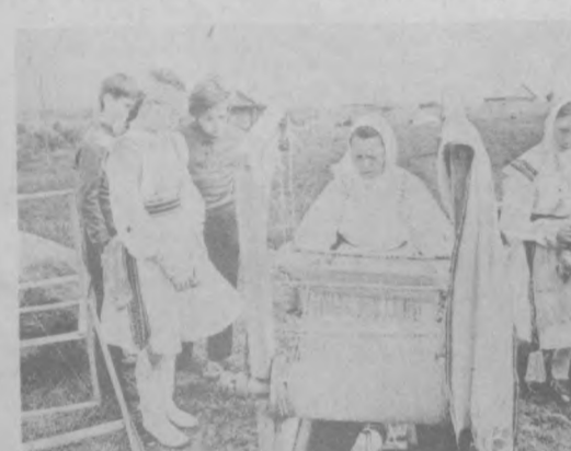
ИЗ БАБУШКИНОГО СУНДУКА МАРИЙСКОЙ ССР. В городе Козьмодемьянске в музее этнографии и быта под открытым небом состоялся фольклорный праздник «Из бабушкиного сундука».

Тяжелые времена, плели корзинки, показывали множество поделок, а еще во всю плясали и пели. Изделия ремесленников можно было купить или получить в подарок. Замечательно, что праздник привлек много молодых людей, стремящихся сохранить то, что нам досталось от предков.