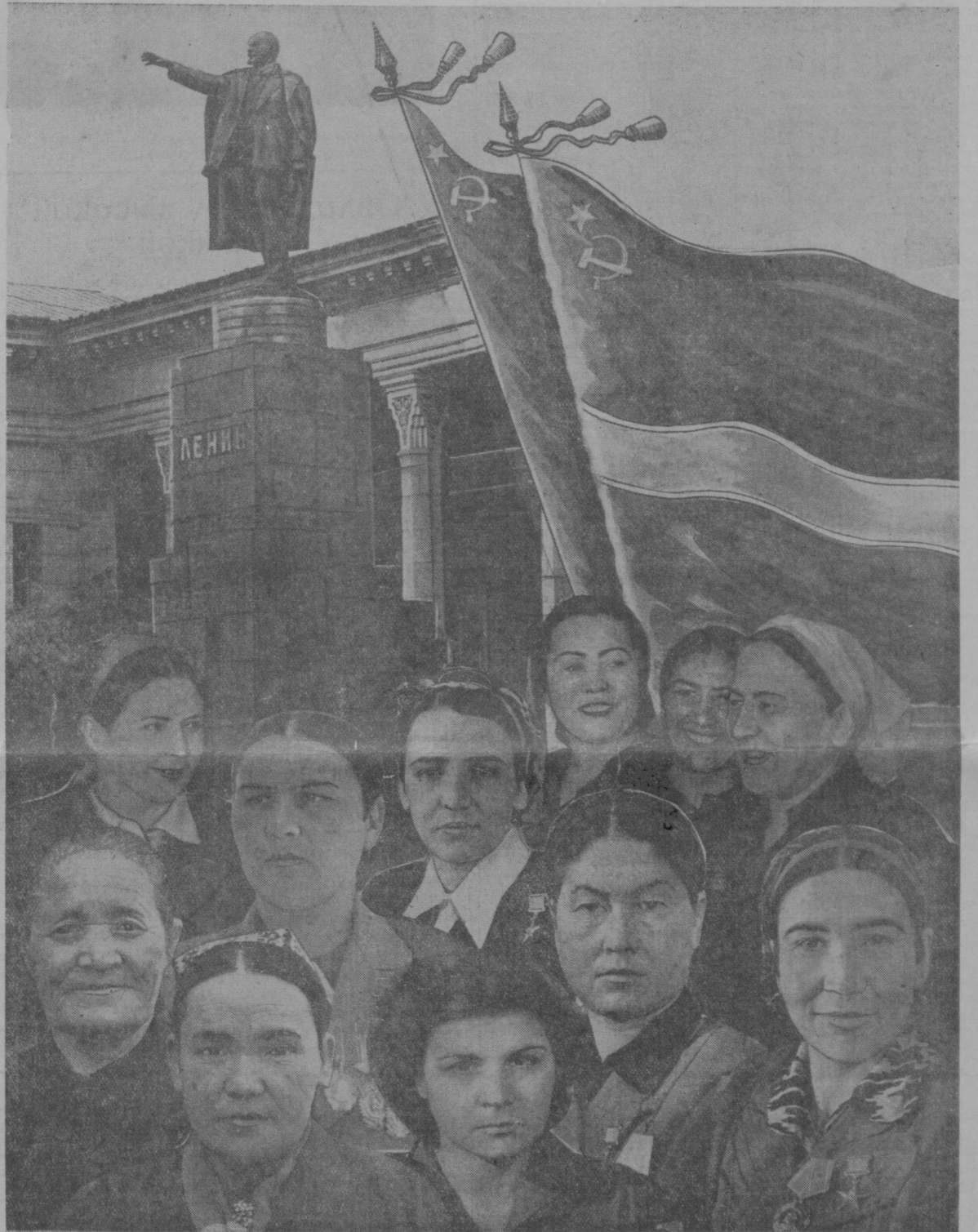
Передовые женщины Узбекистана.

Горячий привет делегатам съезда женщин Узбекистана!