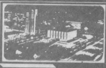
Газета выходит с 1 июля 1966 года