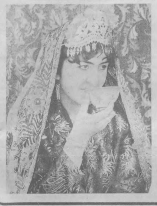
Муслиман доходит. Вспоминается милый друг. Эмир — кипарис, Бухара — сад, Кипарис возвращается в свой сад.

Подобно ярчайшей звезде на небосклоне поэзии Востока засверкало имя Рудаки, не было равных ему в начале X века.