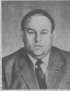
областного Совета народных депутатов.