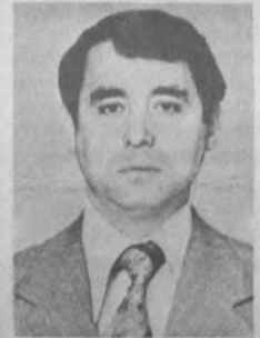
Госплана Республики Узбекистан, директор завода «Алгоритм», председателем Государственного комитета по внешней торговле и зарубежным связям. Удостоен почетного звания «Заслуженный инженер Узбекской ССР».

С 1981 года работает на руководящих должностях в народном хозяйстве — генеральным директором ПО «Средэлектроаппарат», заместителем председателя