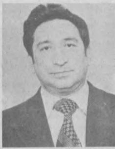
Удостоен почетного звания «Заслуженный экономист Узбекской ССР».

Является народным депутатом Республики Узбекистан.