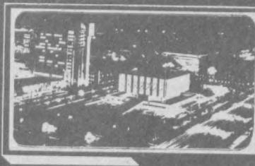
Газета выходит с 1 июля 1966 года