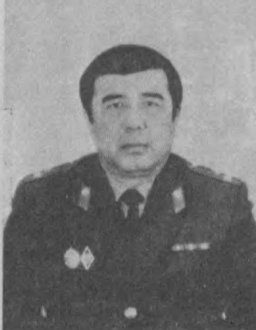
внутренних дел республики, с 1990 года — начальник УВД Ташоблисполкома.

В органах внутренних дел служит с 1971 года в различных должностях среднего и старшего начальствующего состава, начальником отдела внутренних дел Ташкентского райисполкома, заместителем начальника управления внутренних дел Ташоблисполкома, начальником управления уголовного розыска Министерства