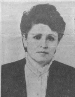
обкома Компартии Узбекистана. Является народным депутатом Республики Узбекистан.

С 1972 года на комсомольско-партийной работе. первый секретарь Фрунзенского района ЛКСМ Узбекистана, секретарь ЦК ЛКСМ Узбекистана, первый секретарь Кировского района Компартии Узбекистана, ответственный секретарь ЦК КПСС, второй секретарь — заведующая отделом организационно-партийной и правотворческой работы Ташкентского