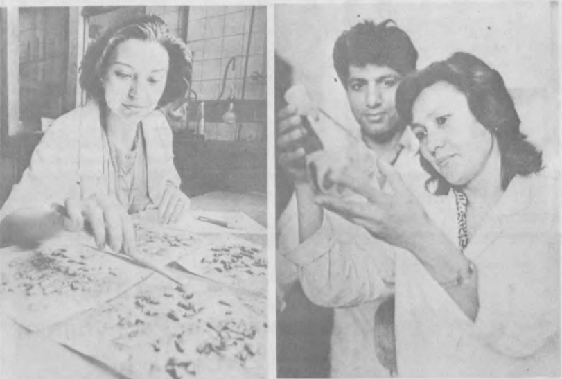
ловушка для массового отлова вредителей. «На крючок» попадают хлопковая, озимая, восклицательная совка и некоторые другие виды вредителей. Вот этот метод, позволяющий увеличить долю биологических методов борьбы с вредителями, значительно сократить расход пестицидов или вовсе отказаться от них, а значит, и значительно уменьшить загрязнение окружающей среды, и заинтересовал ученых из Малайзии.

Основой для контактов и заключения соглашения стал уровень фундаментальных исследований, которые проводятся в нашем институте. Они направлены на развитие агропромышленного комплекса республики и предусматривают изучение факторов, влияющих на качество хлопчатника, физиологические механизмы, лежащие в основе дефолиации, разработку эффективных и безопасных экологических методов борьбы с вредителями, выделение свойств и создание технологически полезных соединений из отходов хлопковой и масличной промышленности и многое другое. В частности,