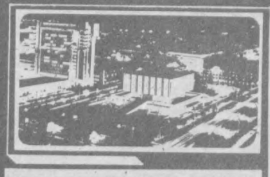
Газета выходит с 1 июля 1966 года