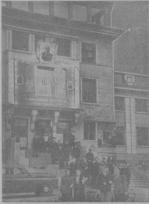
На снимке: вечером у избирательного участка № 129 Фрун- зенского района г. Ташкента.