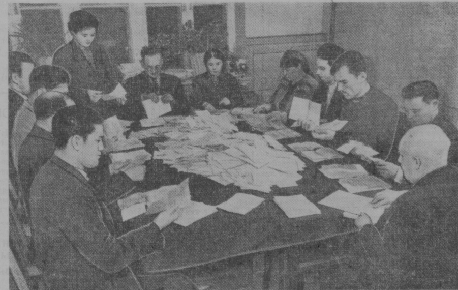
На снимке: подсчет голосов на избирательном участке № 286 Центрального района города Ташкента.

вооруженным глазом перед восходом солнца от 3 градуса до 27 градуса и после захода солнца от 23 градуса до 37 градуса северной широты. (ТАСС)