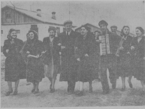
Выборы в Верховный Совет СССР в Узбекистане. На снимке: молодежь Голландии идет на избирательный участок.