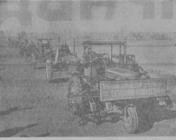
Члены сельхозартели «Коммунизм» Паст-Даргомского района, приобретают сельскохозяйственную технику. Они купили в МТС 35 тракторов и ряд сельскохозяйственных машин. На снимке: колхозники тракторов, купленных колхозом «Коммунизм», направляются в сельхозартель.