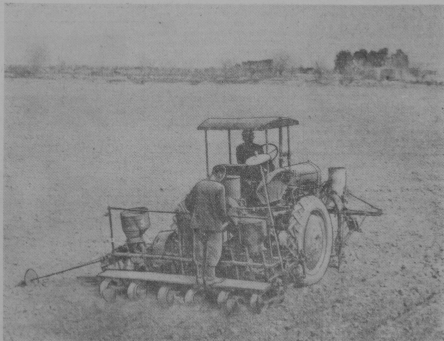
В южных районах Сурхан-Дарьинской области начался сев хлопчатника. Организовано идет посевная в колхозе имени Жданова, Термезского района. Здесь уже более ста гектаров засеяно квадратно-гнездовым способом. На снимке: квадратно-гнездовой сев хлопчатника в шестой полеводческой бригаде.

КАРШИ, 24 марта. (УзТАГ). Здесь начался сев хлопчатника. Первыми к нему приступили колхозы имени Сталина и «Коммунизм», Каршинского района.