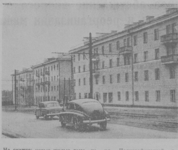
На снимке: новые жилые дома на ул. Полиграфической в г. Ташкенте.

На заводе ведется исследовательская работа по улучшению качества выпускаемой продукции, используемой в тропических условиях. В частности, при изготовлении аппаратов для Индии применены новые виды материалов, устойчивых против влияния жаркого и влажного климата, а также предохраняющие металл от коррозии.