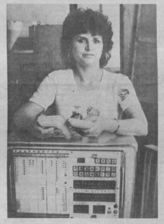
Коллектив ПО «Эталон» готовится к переходу на рыночные отношения, тщательно прорабатывая каждый свой шаг, трезво оценивая обстановку, творчески подходя к делу. К. ОЛЬГИНА.

линость будет устранена. — Планирует ли Московская товарная биржа открыть свое представительство в Республике Узбекистан? — Наша стратегическая цель — создать широкую сеть представительств во всех крупных регионах. Они уже активно действуют в Балтии, в Закавказье, в России... Узбекистан является крупнейшим производителем хлопкового волокна и многим другим сельскохозяйственным продуктам, в которых испытывают дефицит многие районы страны. В то же время республиканский рынок испытывает потребность в сырье и товарах, не производимых здесь. Поэтому мы стремимся к активному сотрудничеству с внешней ассоциацией по информатизации и развитию отраслей агропромышленного комплекса Узбекистана «Нуристон», биржей «Тошкент». Представительство МТБ, по нашему замыслу, должно заниматься информационными связями, изучением конъюнктуры рынка, другими взаимовыгодными операциями. Естественно, главным условием здесь является ведение дел на долгосрочной, взаимовыгодной, честной основе. МТБ дорожит своим авторитетом. Он завоевывался не просто. В наших планах также создание Узбекско-Российского торгового дома. Его задача — осуществлять коммерческую деятельность не только на территории Республики Узбекистан, но и всего Среднеазиатского региона. Образно говоря, этот торго-