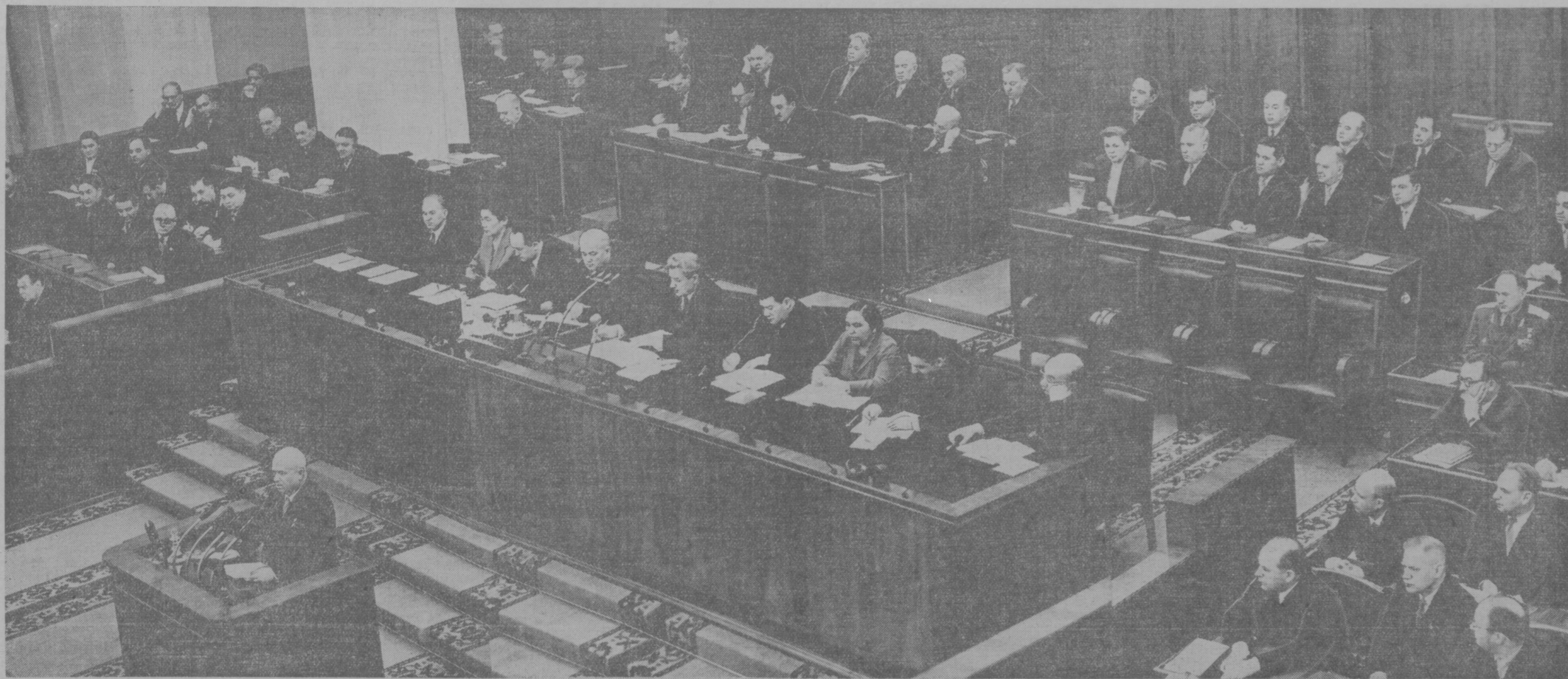
Москва. Первая сессия Верховного Совета СССР пятого созыва. Совместное заседание Совета Союза и Совета Национальностей 27 марта. На трибуне — Первый секретарь ЦК КПСС и Председатель Совета Министров СССР товарищ Н. С. Хрущев.