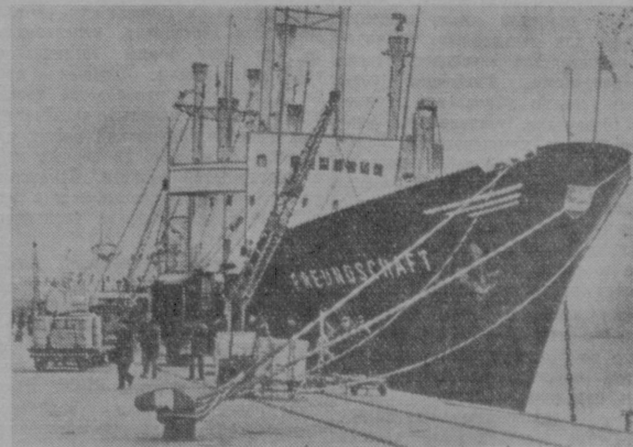
Недавно 10.000-тонное морское торговое судно «Фрейндштафт» («Дружба») первым среди судов Германской Демократической Республики совершило рейс на Дальний Восток. Расстояние до Шанхая, равное приблизительно 13.000 морских миль, было покрыто за 41 день. На снимке: «Фрейндштафт» в Шанхайском порту.

Фелл сказал, что он лично не удовлетворен ответами премьер-министра, и под одобрительные возгласы лейбористов заявил, что использует всякий случай, который представится, для того, чтобы вновь поставить этот вопрос.