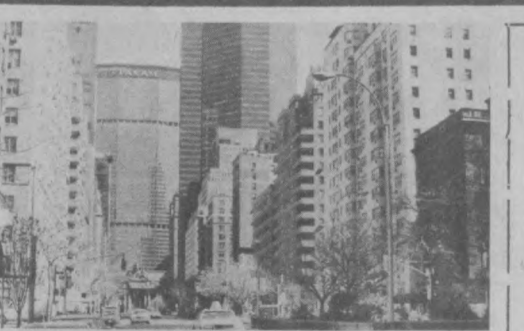
По городам и странам

Свое участие в этой работе гарантировали и члены объединения «Двухсекторная экономика», ведь их идея начинает обретать плоть и кровь. И кто знает, может, их усилия, их доброты помогут республике оказаться в более эффективных, чем советские времена, условиях.