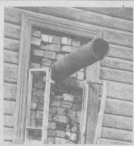
В цехах авиационного объединения идет ремонт зданий.

К зиме как можно больше производственных площадей, которые многие годы оставались вне поля деятельности заводских механиков, объединение вынуждено было искать подрядчика, который выполнял бы ремонтные работы со своим материалом.