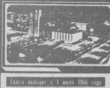
Газета выходит с 1 июля 1966 года

Обсуждаем проекты Устава и Программы НДП