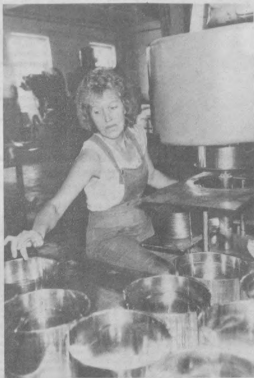
В Узбекском обществе дружны