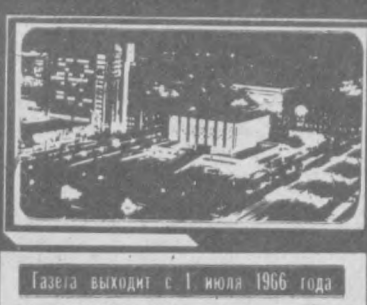
Газета выходит с 1 июля 1966 года