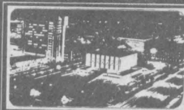
Газета выходит с 1 июля 1966 года