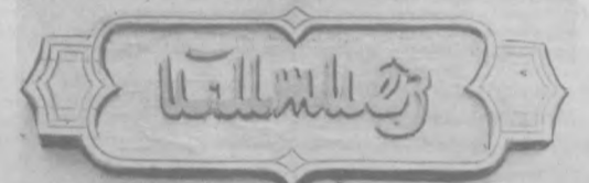
ТАК НАЗЫВАЕТСЯ ОДИН ИЗ МАГАЗИНОВ СЕРДЕЛИЙСКОГО РАЙОНА