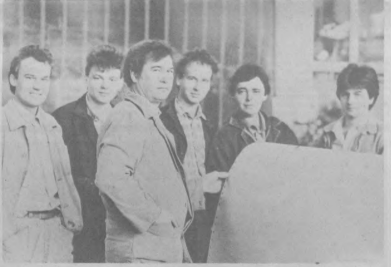
Возвращающие жизнь самолетам

— Для обеспечения максимальной возможной материальной стабильности в семьях работников завода наряду с ме-