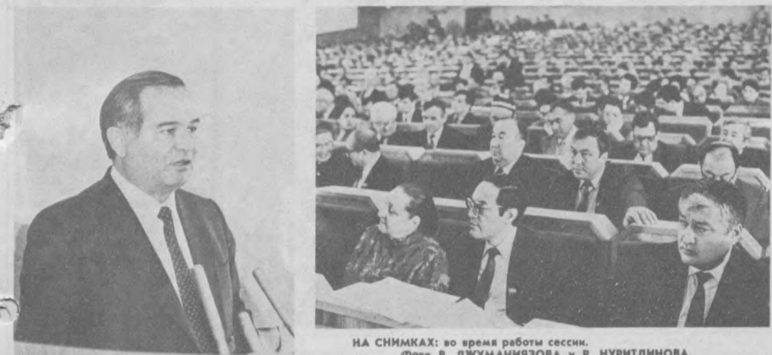
НА СНИМКАХ: во время работы сессии.

Восьмая сессия Верховного Совета Республики Узбекистан двенадцатого созыва